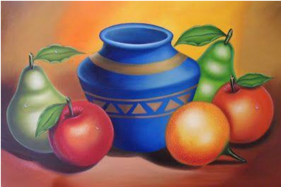
Imagen de Referencia para Artes Visuales: